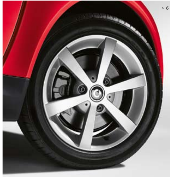
> 6 6-Speichen-Leichtmetallräder (15", Design 3): Für Bereifung 175/55 R15 vorn und 195/50 R15 hinten.