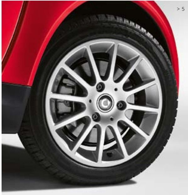
> 5 12-Speichen-Leichtmetallräder (15", Design 1): Für Bereifung 155/60 R15 vorn und 175/55 R15 hinten.