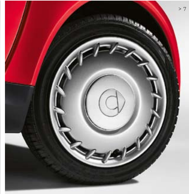
> 7 Radzierblende für Stahlrad: Verschönert die serienmäßige Stahlfelge und schützt die Radbefestigungsschrauben vor Witterungseinflüssen. Nicht nur für Winterräder ideal.